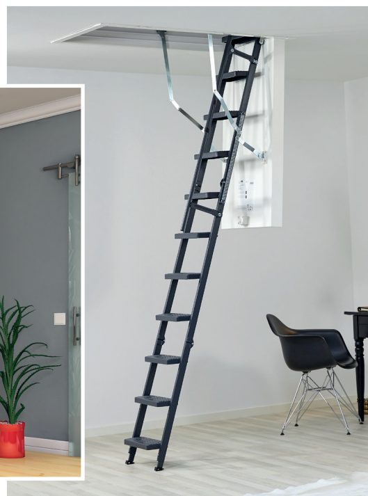
▲ ISOCLIC PRO CONFORT