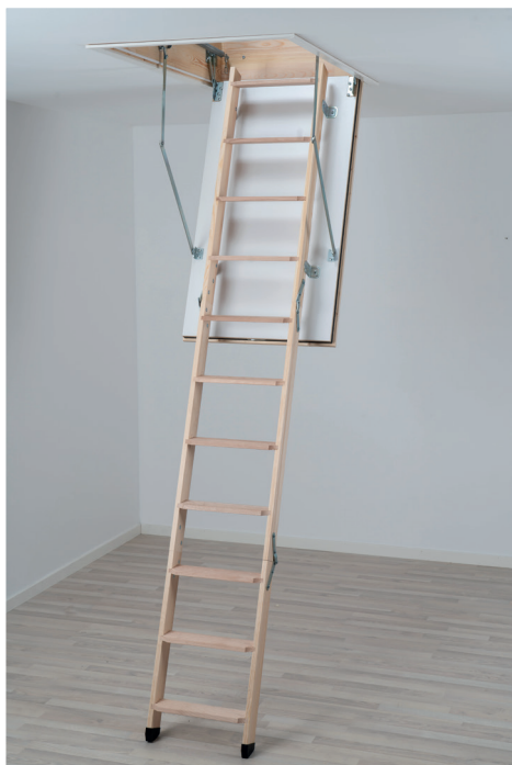
▲ FIRE PRO REI 45