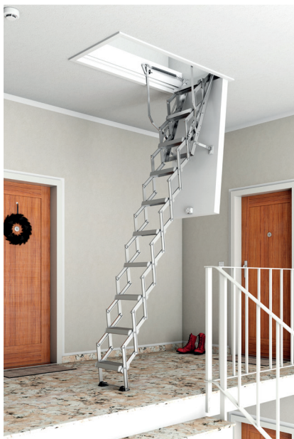
▲ ClickFix® 76G VARIO