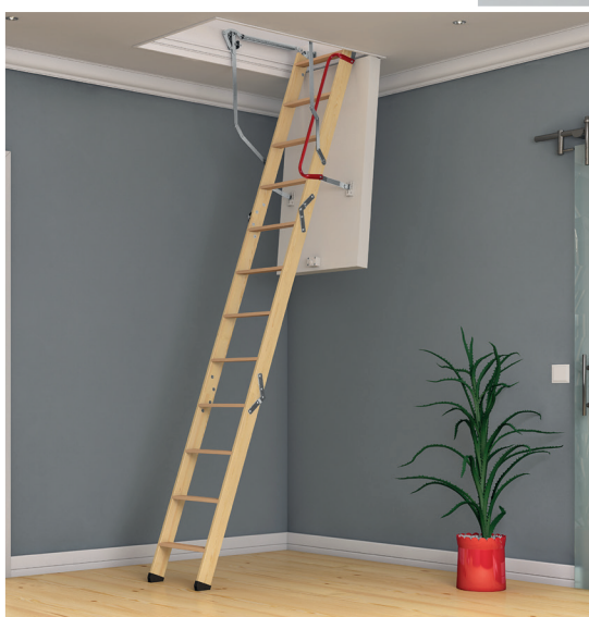
▲ ISOCLIC PRO 76